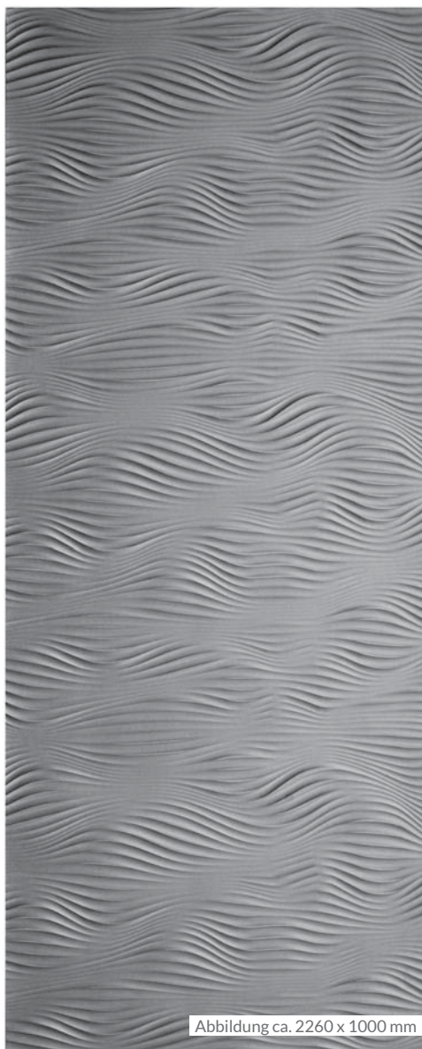
Abbildung ca. 2260 x 1000 mm