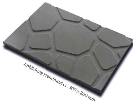
Abbildung Handmuster: 300 x 200 mm