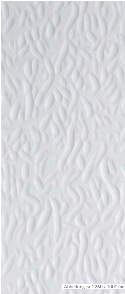
Abbildung ca. 2260 x 1000 mm