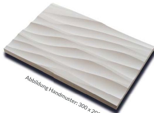
Abbildung Handmuster: 300 x 200 mm