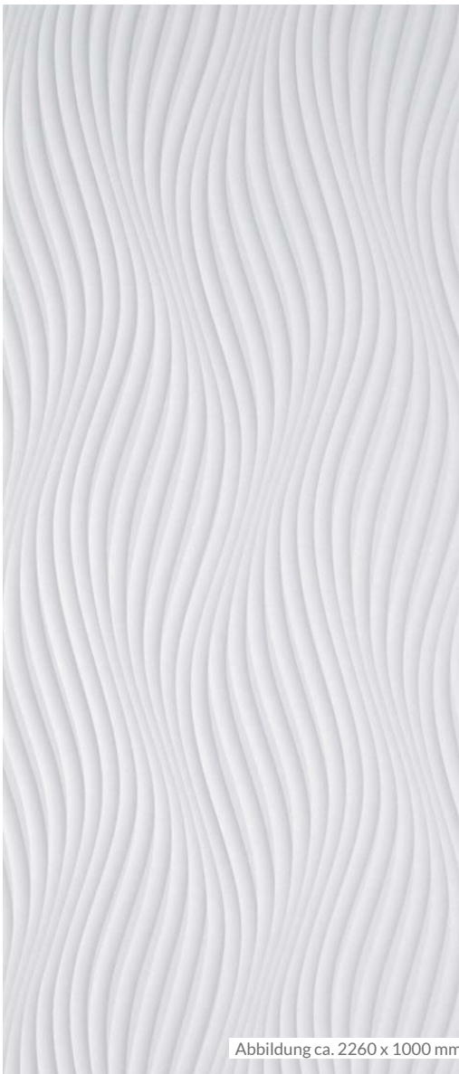
Abbildung ca. 2260 x 1000 mm