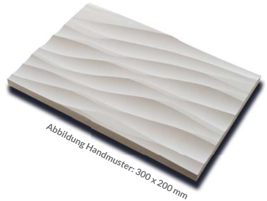
Abbildung Handmuster: 300 x 200 mm