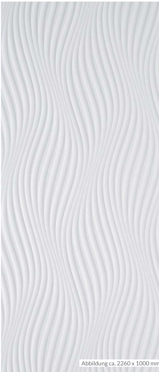
Abbildung ca. 2260 x 1000 mm