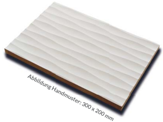
Abbildung Handmuster: 300 x 200 mm