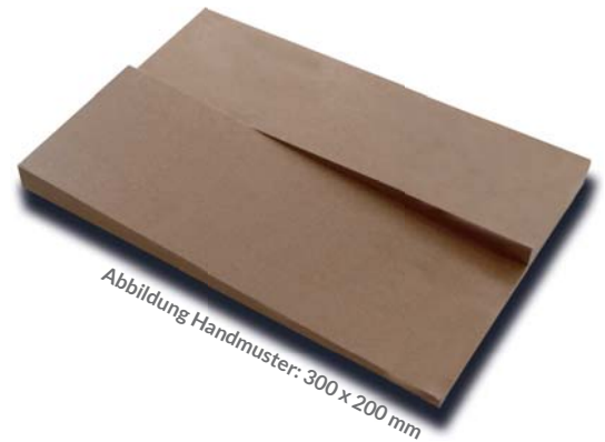
Abbildung Handmuster: 300 x 200 mm