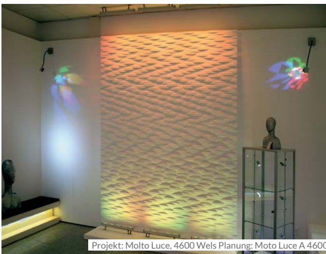
Projekt: Molto Luce, 4600 Wels Planung: Moto Luce A 4600