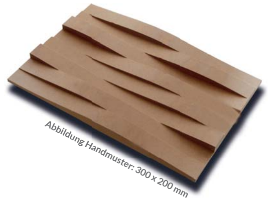
Abbildung Handmuster: 300 x 200 mm