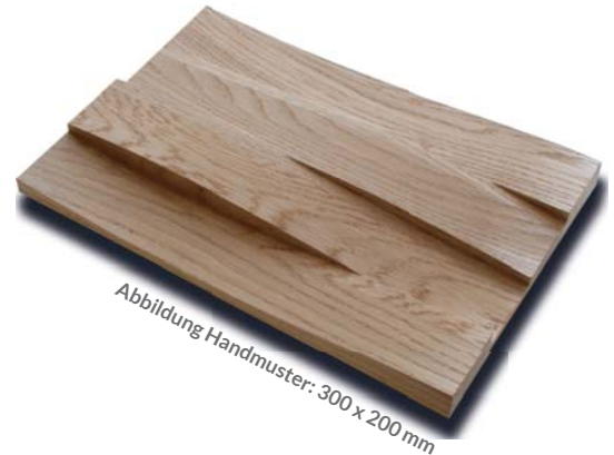
Abbildung Handmuster: 300 x 200 mm