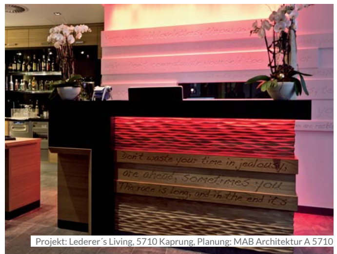
Projekt: Lederer's Living, 5710 Kaprun, Planung: MAB Architektur A 5710