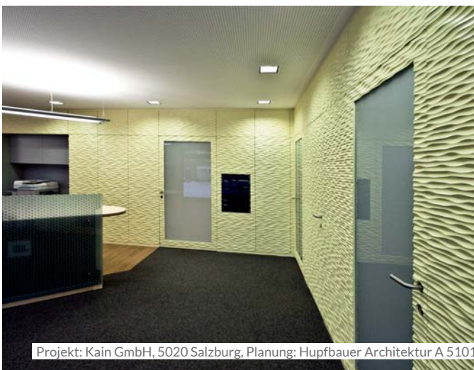
Projekt: Kain GmbH, 5020 Salzburg, Planung: Hupfbauer Architektur A 5101