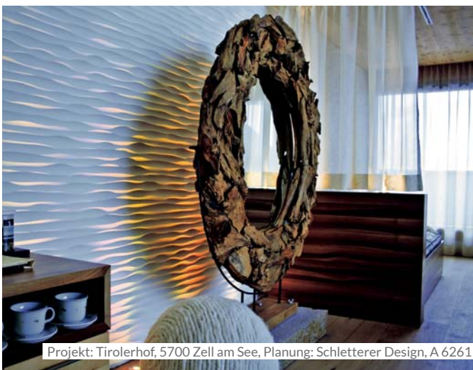
Projekt: Tirolerhof, 5700 Zell am See, Planung: Schletterer Design, A 6261