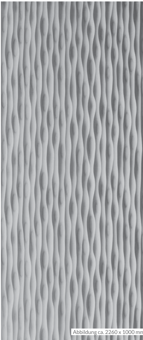
Abbildung ca. 2260 x 1000 mm