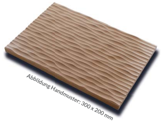
Abbildung Handmuster: 300 x 200 mm