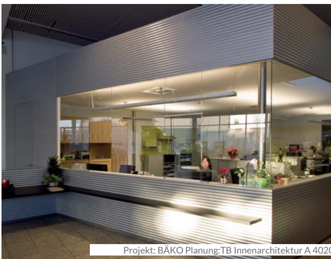
Projekt: BÄKO Planung:TB Innenarchitektur A 4020