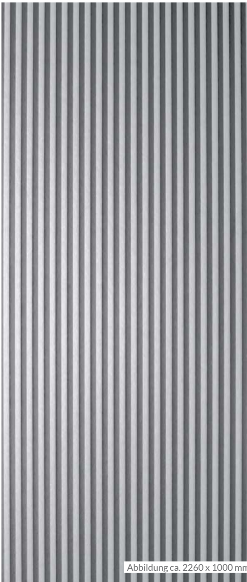
Abbildung ca. 2260 x 1000 mm