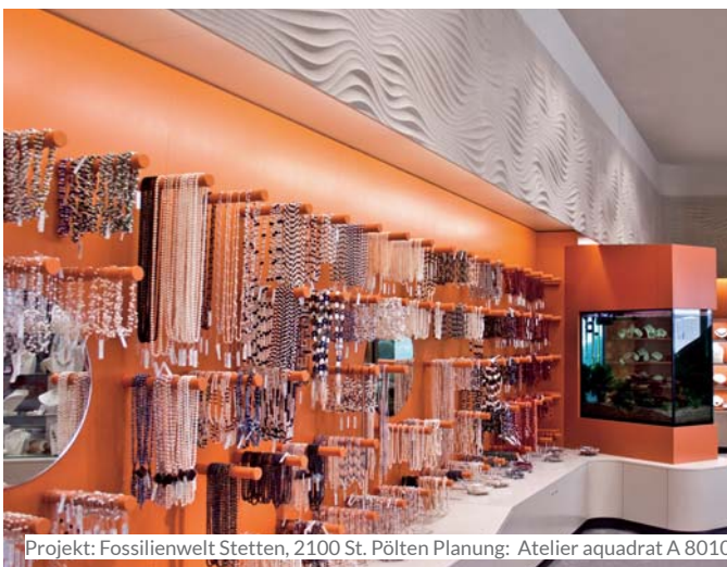
Projekt: Fossilienwelt Stetten, 2100 St. Pölten Planung: Atelier aquadrat A 8010