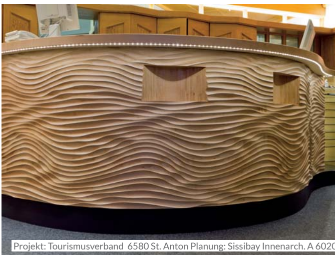
Projekt: Tourismusverband 6580 St. Anton Planung: Sissibay Innenarch. A 6020