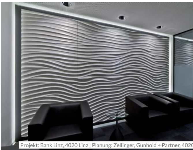
Projekt: Bank Linz, 4020 Linz | Planung: Zellinger, Gunhold + Partner, 4020