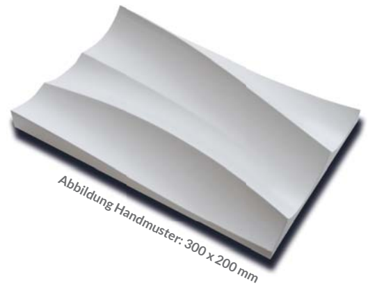
Abbildung Handmuster: 300 x 200 mm