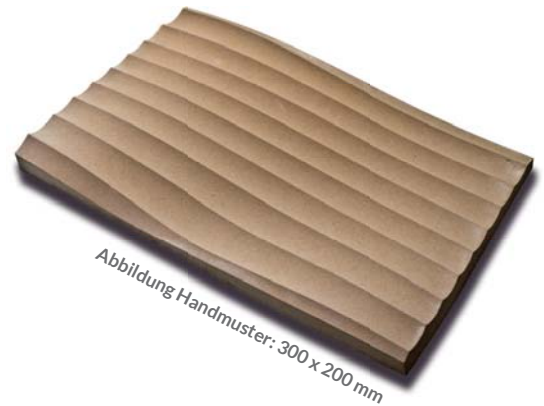
Abbildung Handmuster: 300 x 200 mm