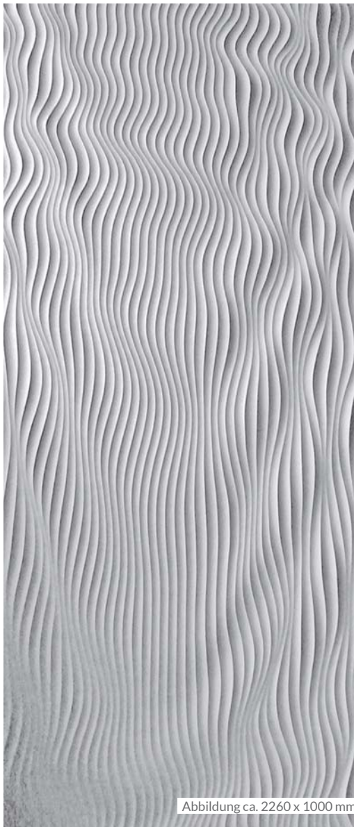
Abbildung ca. 2260 x 1000 mm