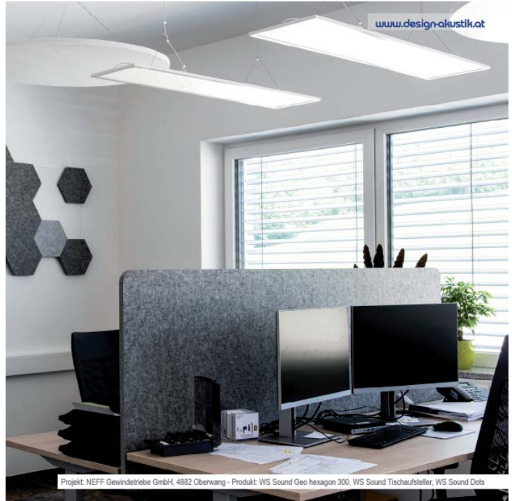
Projekt: NEFF Gewindetriebe GmbH, 4882 Oberwang - Produkt: WS Sound Geo hexagon 300, WS Sound Tischaufsteller, WS Sound Dots

Achtung: Prüfung nur in Ausführung natur