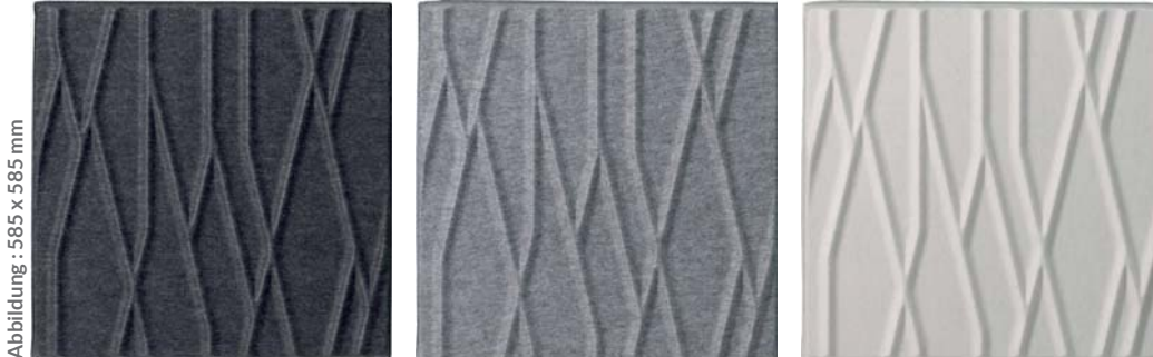
Abbildung: 585 x 585 mm