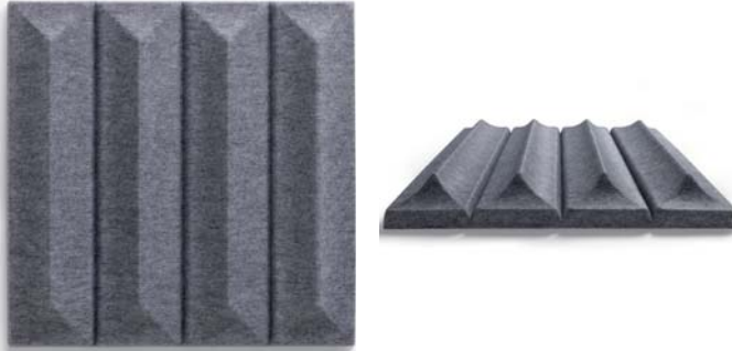
Abbildung : 585 x 585 mm